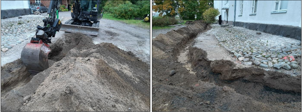
Vasen. Kaivuutyö menossa lähempänä rakennuksen koilliskulmaa. Alue täyttömaata. Oikea. Kaivanto valmiina Tanssiopiston itäseinustalla, kuva rakennuksen koilliskulman kohdalta kohti kaakkoiskulmaa.