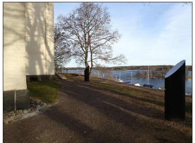
Vasen. Rakennuksen itä- ja koillispuolelle asennetut valaisimet ennen siirtoa. Oikea. Valaisimet rakennuksen kaakkoiskulmalla. Pohjoisempi valaisin siirretään porraskaiteen edustalle.