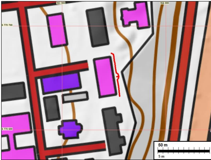
1) Punaisella viivalla syyskuussa valvonnassa kaivetun kaivannon sijainti rakennuksen nro 65 edustalla.