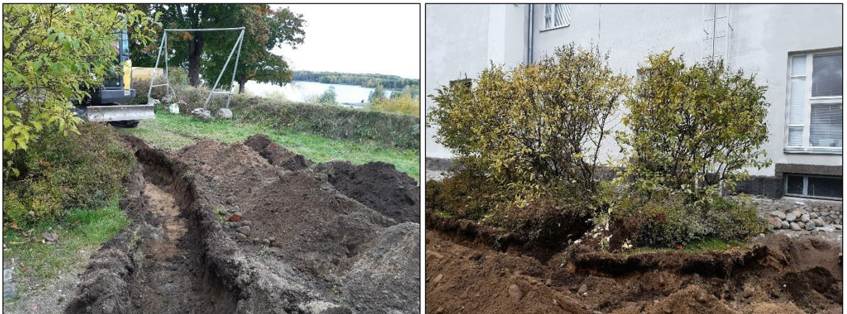
Vasen. Kaivanto kiersi seinustalla olevan pensaan. Oikea. Yhdelle valaisinpylvään kaapelille kaivettiin oma ojanpätkä pensaan poikki.