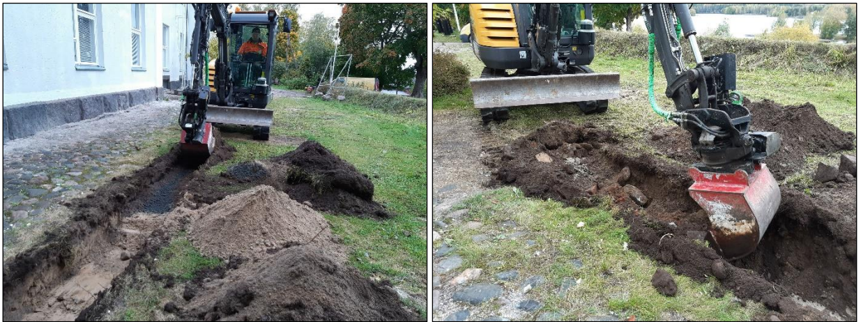
Vasen. Kaivuutyö käynnissä, rakennuksen kaakkoiskulman kohdalla, ensimmäiset 2 metriä alueella oli puhdasta hiekkamaata nurmikon alla, sen jälkeen maaperä vaihtui täyttökerrokseen. Oikea. Muutamia tiilen kappaleita ja kiviä havaittiin ojan kohdalla.

Kaivetun ojan syvyys oli n. 20 – 30 cm ja leveys n. 50 cm. Havaintoja löydöistä ei tehty, muutamia astian paloja sekä moderneja metalliesineiden kappaleita havaittiin ojan alueella.